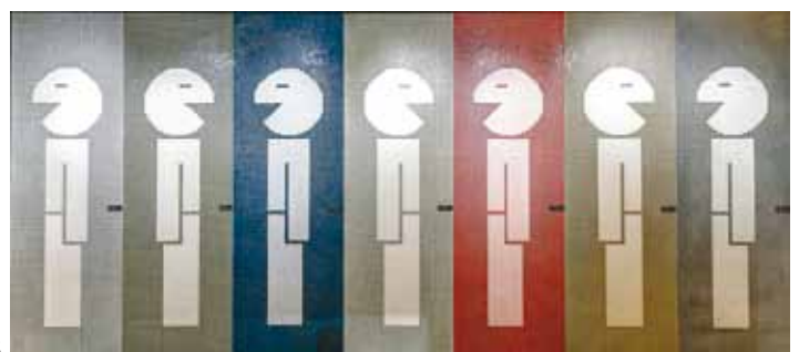
Die Jasba-Sopro-Mosaik-Kooperation des BAU-Messestandes 2015

Sopro Bauchemie GmbH (Biebricher Straße 74, 65203 Wiesbaden, Tel.: 0611-1707-0, www.sopro.de , Jasba Mosaik GmbH, Im Petersborn 2, 56244 Ötzingen, Tel.: 02602-682-0, www.jasba.de/de/